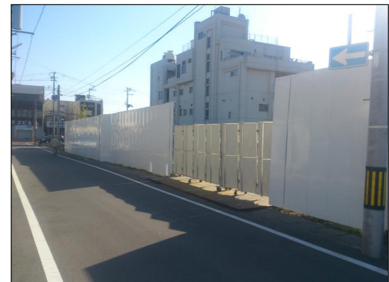
参考写真 C: 鋼板塀 (h=2.0m)、ゲート