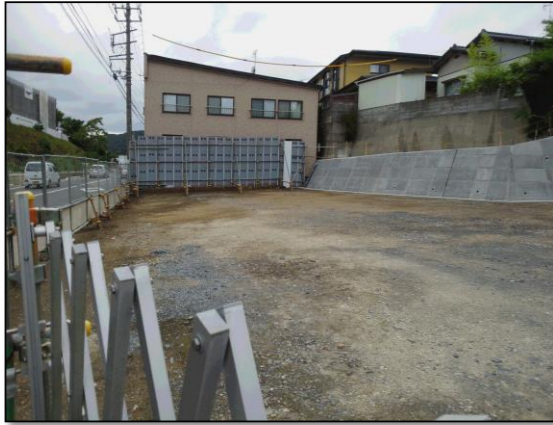
参考写真 A: 鋼板塀 (h=3.0m,防音パネ補強)