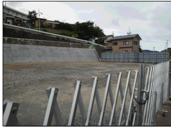
参考写真 B: 鋼板塀 (h=3.0m,防音パネ補強)