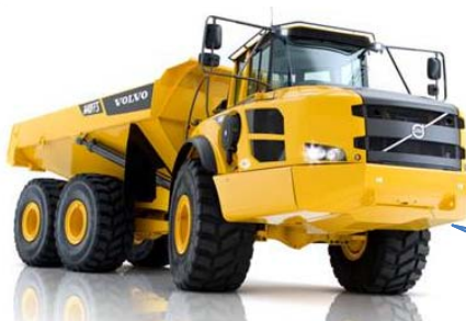
堀切山工区に導入されている ボルボA40Fアーティキュレート式ガンフトラック

お問合せ先：女川町復興推進課 復興調整係 電話：0225(54)3131 内線292