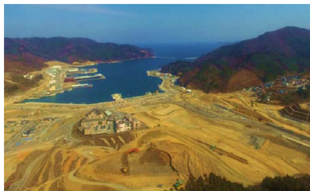
堀切山高台からの眺望(平成28年4月現在)