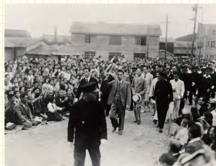
▲駅前でのお見送り風景