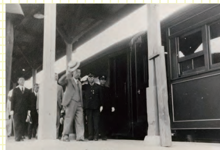
▲女川駅ホームで民衆に応える昭和天皇