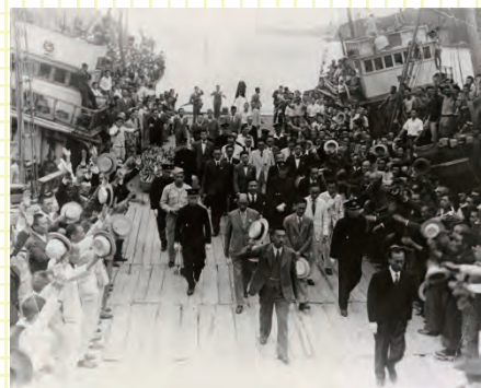
▲魚市場を視察する昭和天皇