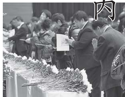
▲昨年の式典の様子