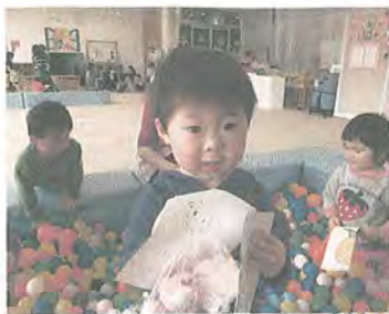
3/18(木) おひなまつ会 絵あわせゲーム ロビーでふんいどん