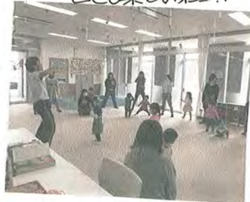
3/10(火) 幼児体操教室。 いっぱい体を動かして とても楽しかったです!!