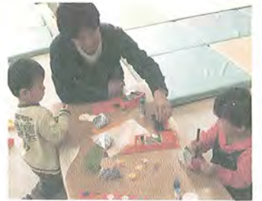
3/17(金) おひなさまを 作ろう