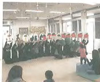
3/13(金) 名古屋短期大学の 学生さん18名にお 「はらへにああし」