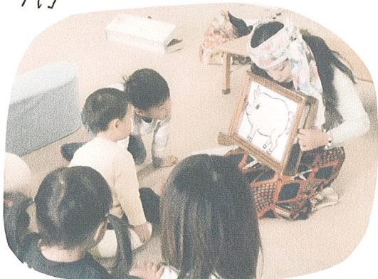
2/5 紙しばいなっちゃん